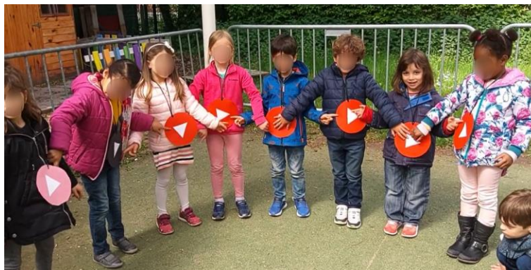
La vidéo Fair Play des M3A

Le concours d'art graphique a été clôturé fin mai. Les 6 classes des M2 et M3 ont participé à la création d'un petit film et la création a bien été réceptionnée par l'ASBL.